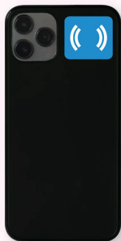
iPhone X, XS, XS Max, XR, 11, 11 Pro Max, Pro, SE, 12