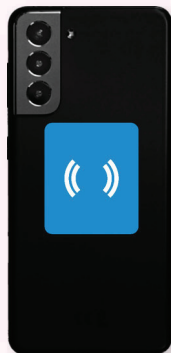
Galaxy S7 Edge, S8, S8+, S9, S10, S20, S21